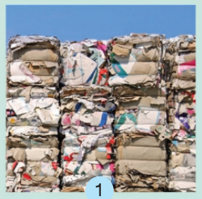
The Circular Material Hub

CMH เชื่อมโยงระหว่างข้อมูลของเสียและผลพลอยได้จากอุตสาหกรรมต่างๆ กับภาคธุรกิจที่ต้องการของเสียไปใช้พัฒนาผลิตภัณฑ์ใหม่ที่มีมูลค่าสูงขึ้น CMH เป็นแหล่งข้อมูลความรู้ที่ช่วยในการพัฒนาไปสู่วิสัยทัศน์และผลิตภัณฑ์แบบหมุนเวียนและเชื่อมโยงกับแพลตฟอร์มฐานข้อมูลของเสียหรือผลิตภัณฑ์ที่ได้รับการพัฒนาเพื่อลดผลกระทบต่อสิ่งแวดล้อม CMH เป็นแหล่งรวบรวมบทความเกี่ยวกับนวัตกรรมและกรณีความสำเร็จ เพื่อเป็นต้นแบบสำหรับการพัฒนาเศรษฐกิจหมุนเวียน