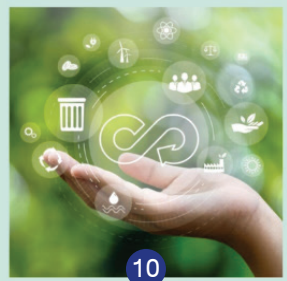
What is Circular Economy?

แพลตฟอร์ม CMH เพื่อให้การบริการในบริการที่มีความเกี่ยวข้องกับอุตสาหกรรมแบบพึ่งพาได้