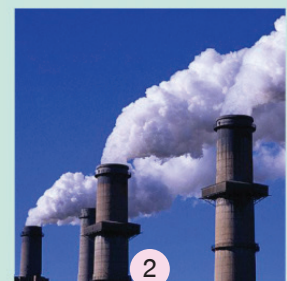
GHG emission calculating Tools

เศรษฐกิจหมุนเวียนคืออะไร? โดย World Economic Forum ได้ให้คำจำกัดความของเศรษฐกิจหมุนเวียน